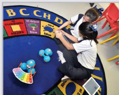
Programando con los Robots Dash & Dot

Implementamos un modelo educativo que responde a este mundo cambiante, con una metodología centrada en el estudiante y propiciando el desarrollo de habilidades y competencias a través del aprendizaje activo.